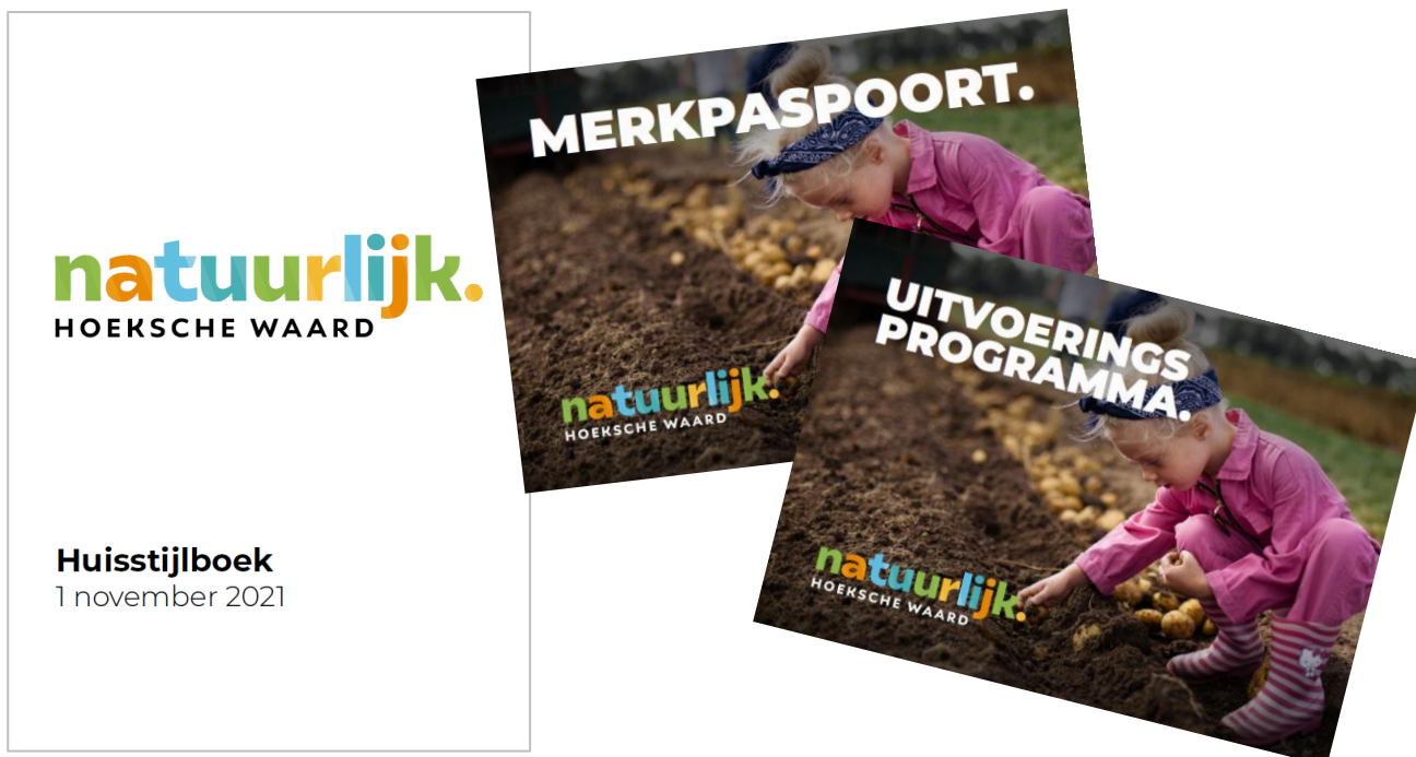
Figuur 3: Het huisstijlhandboek, merkpaspoort en uitvoeringsprogramma (2021)

Na besluitvorming heeft de gemeente opdracht gegeven aan een reclamebureau om de huisstijl en het merkpaspoort te ontwikkelen. 13 Tegelijkertijd is gewerkt aan het uitvoeringsprogramma (met KPI's). In november 2021 worden het uitvoeringsprogramma, merkpaspoort en huisstijlboek gebiedsmarketing Hoeksche Waard via een raadsinformatiebrief aangeboden aan de gemeenteraad (zie Figuur 3).