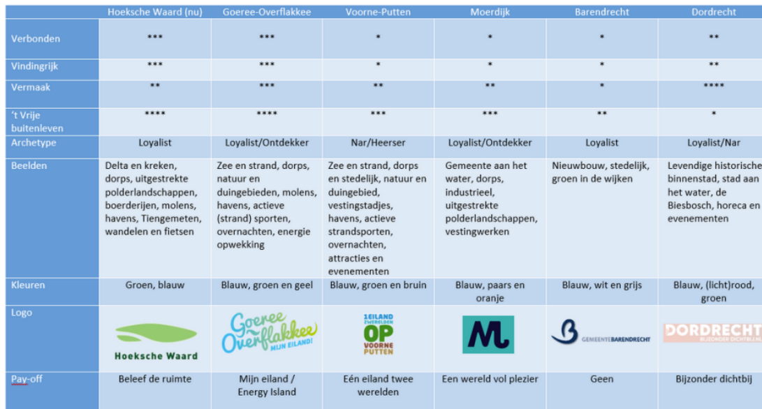
Figuur 1: Concurrentieanalyse