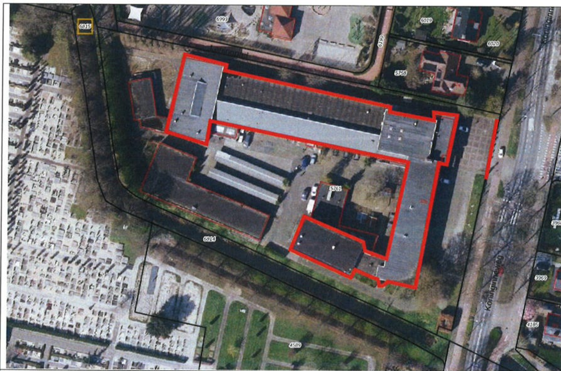
Fig. 3. Uitsnede luchtfoto met kadastrale grenzen met handmatig de begrenzing van de onroerende delen van het gemeentelijk monument aangegeven.