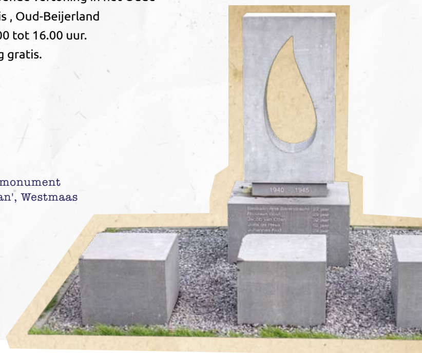
Oorlogsmonument 'De Traan', Westmaas

Unieke filmopnames uit 1955 met historische optochten en herdenkingen. Doorlopende vertoning in het Oude Raadhuis, Oud-Beijerland van 10.00 tot 16.00 uur. Toegang gratis.